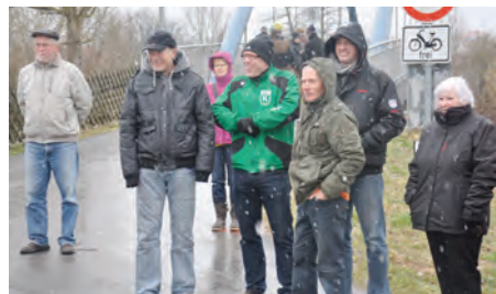
Frierende aber gut gelaunte Zuschauer in den Neckarauen.

Das hatte es in 10 Jahren Kiebinger Osterlauf bisher auch noch nie gegeben – dichtes Schneegestöber zu Beginn des Hauptlaufes. Der Stimmung beim Jubiläumslauf tat dies jedoch keinen Abbruch. Der neue Voranmelderekord von 799 Startern in allen Wettkampfklassen ließ schon im Vorfeld erahnen, was es für ein Gewimmel am Samstag geben würde. Organisatorisch war alles bestens vorbereitet, die Sülchgauhalle bereits am Freitagabend festlich herausgeputzt. Über 80 leckere Kuchen (Wahnsinn – auch das ist neuer Rekord!!!) und 400 Rote warteten auf die nach dem Wettkampf hungrigen Läufer. ▶