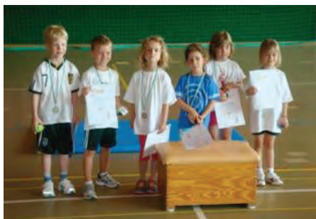
Die Vorschulturner in der Bewegungslandschaft

Im Anschluss daran zeigten die Vorschulkinder in einer Bewegungslandschaft tolle Sprung- und Balancierübungen. Auch hier gab es zum Schluss Medaillen und Urkunden.