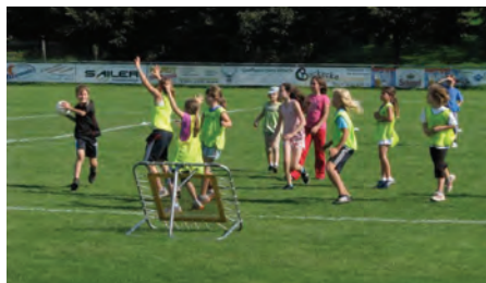
Kampf um den Ball beim Tschoukball-Turnier

Für 3 Stunden machte der Sportplatz seinem Namen alle Ehre. Auf fast dem ganzen Sportgelände wurden verschiedene Sportarten angeboten. Von Baseball über Hockey, Pedalos, Rasenski bis hin zu dem eher unbekanntem Tschoukball, konnten 25 Kinder unter Anleitung alles ausprobieren, wozu sie Lust hatten. Den Abschluss bildete ein Tschoukballturnier mit allen teilnehmenden Kindern