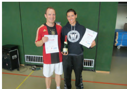
Die Turniersieger „Hofstätter“

Das Schlussdoppel wurde dennoch gespielt um den Zuschauern etwas zu bieten und dieses Spiel konnten dann „die Fabis“ für sich entscheiden.