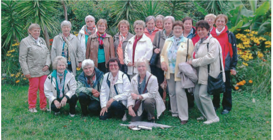
Ausflug zur Insel Mainau 14. September 2014

Auch im zu Ende gehenden Jahr traf sich die Frauengymnastikgruppe jeden Montagabend, um etwas für die Fitness zu tun. Im Mittelpunkt stehen für uns keine sportlichen Leistungen, sondern Übungen für die Beweglichkeit und Gesundheit.