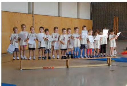
Die Spielturnkinder nach ihrer gelungenen Vorführung

Am Samstag waren traditionsgemäß zunächst die Spielturner an der Reihe. In einer bunten Märchenstunde zeigten die jüngsten Turnkinder, was sie im vergangenen Jahr gelernt haben. Unter großem Beifall der zuschauenden Eltern bekam jedes Kind ein T-Shirt und eine Medaille.