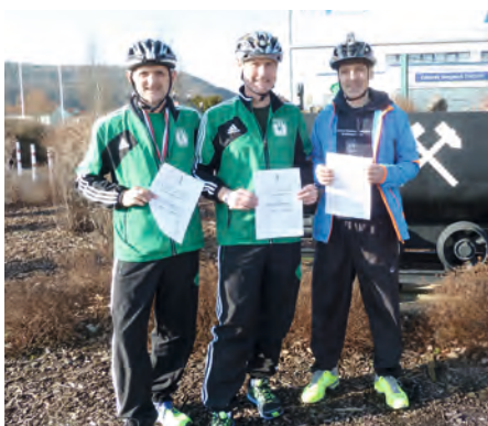
Mit zwei Altersklassensiegen und einem 3. Platz konnten die Kiebinger Läufer sehr zufrieden sein