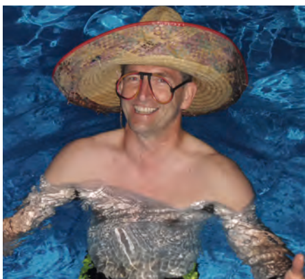
Lustig ging es dann auch bei der Poolparty zu

Eine komplette Ergebnisübersicht und einzelne Wettkampfbereiche sind auf der Homepage des TSV hinterlegt.