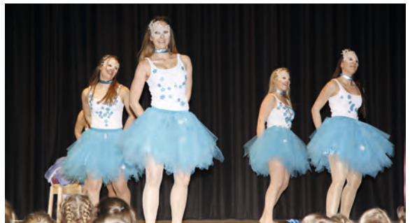
Stimmungsvoller Auftritt der NoLimits, die seit vielen Jahren die Siegerehrung bereichern